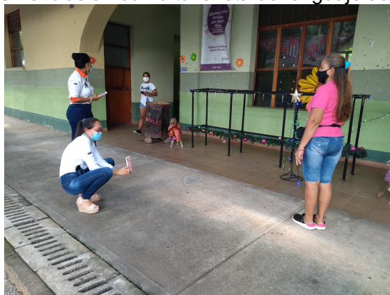
Municipio de Coello