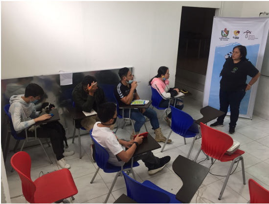
Municipio de Santa Isabel

Indeleble ganador del FDC 2012. Con más de 10 años de experiencia como productora y realizadora audiovisual.