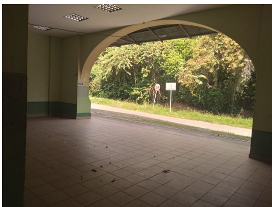
Municipio de Coello- corregimiento de Gualanday