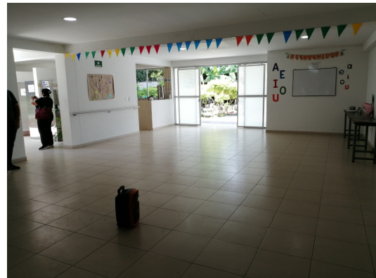
Municipio de Alvarado