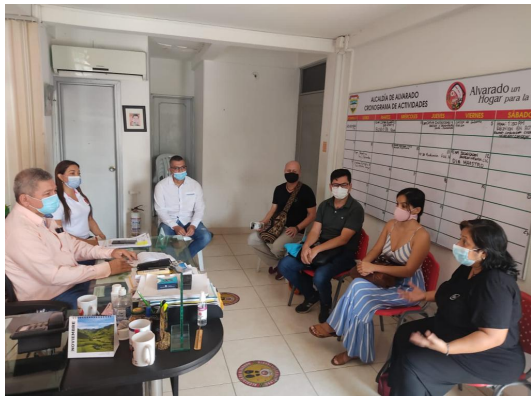
Municipio de Alvarado