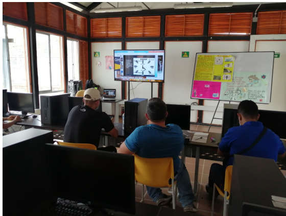
Municipio de Alvarado