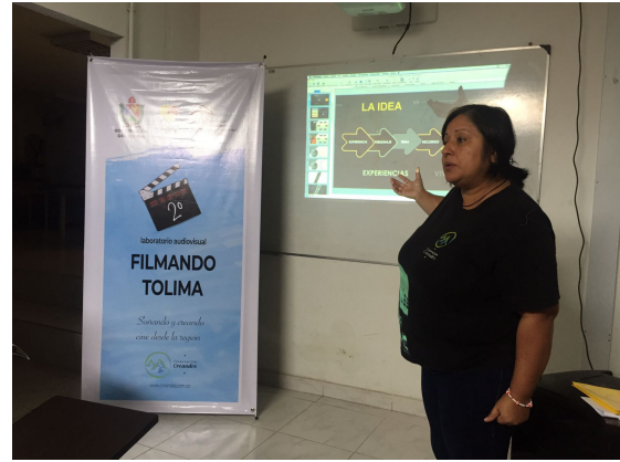
Municipio de Santa Isabel

4. Realizar cuatro (4) talleres en realización audiovisual, con una duración mínima de veinte (20) horas. Los talleristas deberán tener una experiencia mínima de tres (3) años cine y televisión / comunicación y/o afines, con estudios en cine y/o audiovisuales.