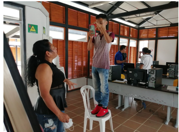
Municipio de Alvarado