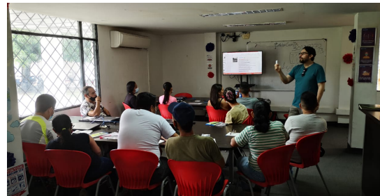
Municipio de Armero Guayabal