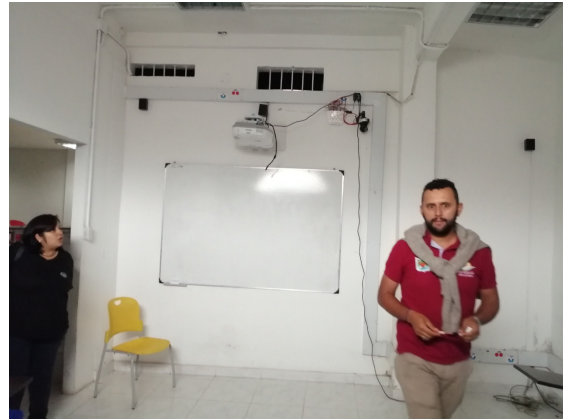
Municipio de Santa Isabel