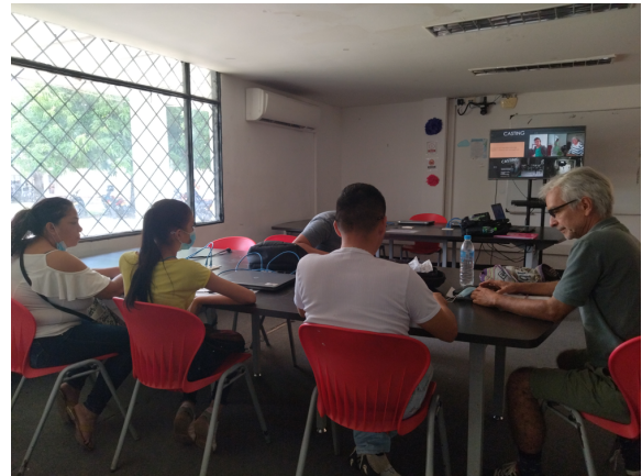
Municipio de Armero Guayabal