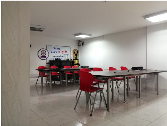
Municipio de Santa Isabel