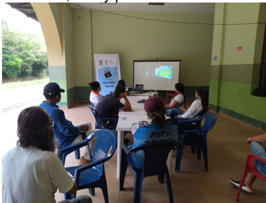
Municipio de Coello