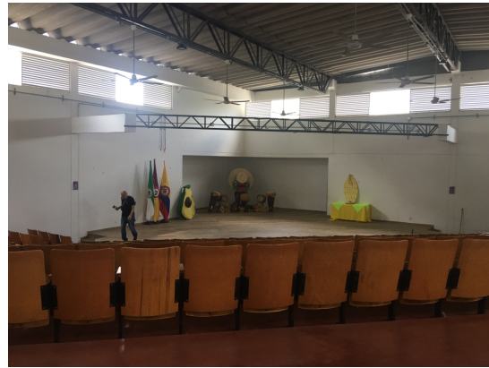
Municipio de Armero Guayabal