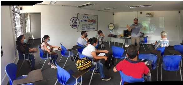
Municipio de Armero Guayabal