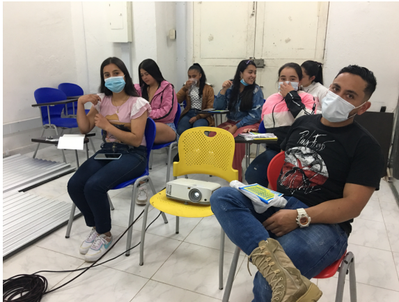
Municipio de Santa Isabel