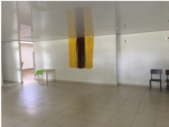
Municipio de Armero Guayabal