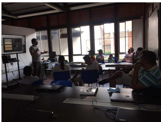
Municipio de Alvarado