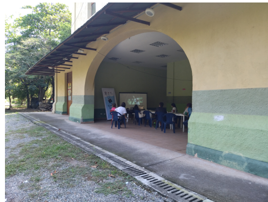
Municipio de Coello