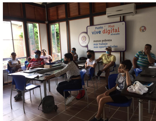
Municipio de Alvarado