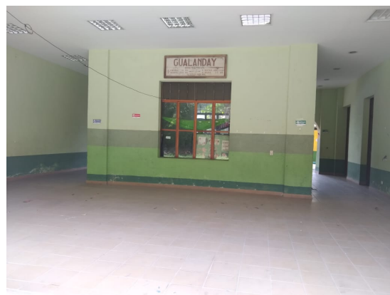
Municipio de Coello- corregimiento de Gualanday