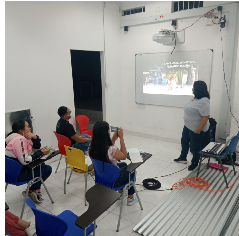
Municipio de Santa Isabel

3. Realizar cuatro (4) talleres en producción audiovisual, con una duración mínima de doce (12) horas. Los talleristas deberán tener una experiencia mínima de tres (3) años en cine y televisión / comunicación y/o afines, con estudios en cine y/o audiovisuales.